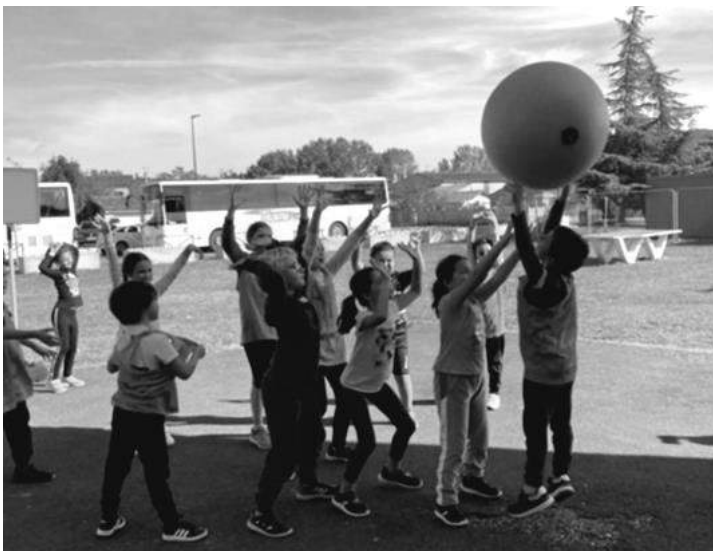
Rencontre sportive « multi-activités »

Les projets proposés contribuent à favoriser le plaisir d'apprendre et à créer une bonne dynamique de classe. Nous souhaitons à tous les élèves et parents du RPI une bonne année scolaire 2021/2022.